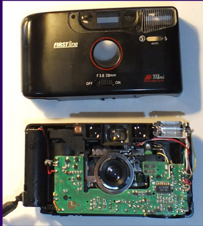
_Fabrication du prototype_