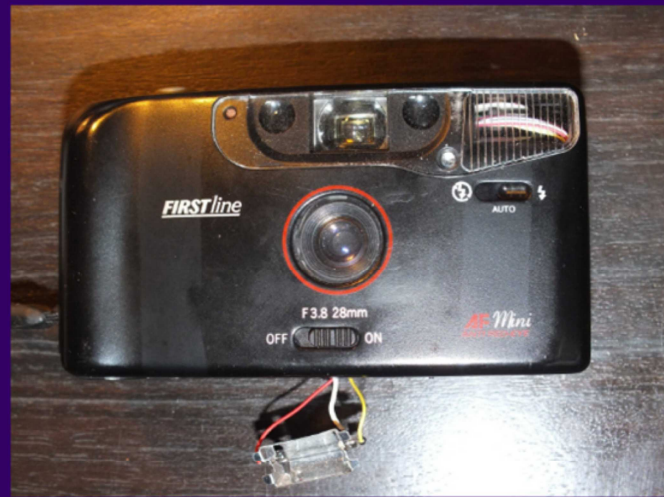
_Deuxième opération : Déplacement du flash sous l'objectif de l'appareil ph